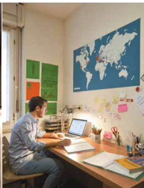
Visita il campus e le residenze Bocconi