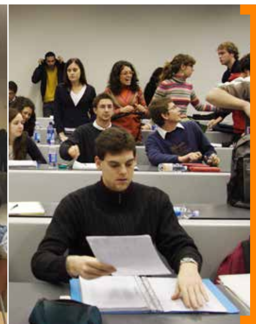
Partecipa a una simulazione del test di selezione