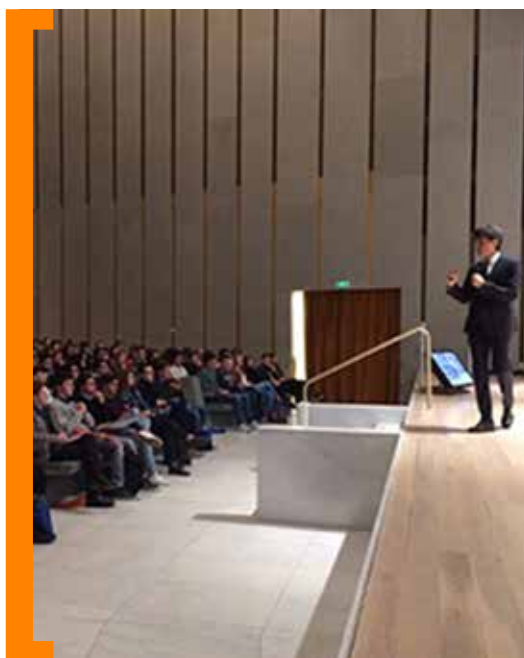
Approfondisci il contenuto dei corsi